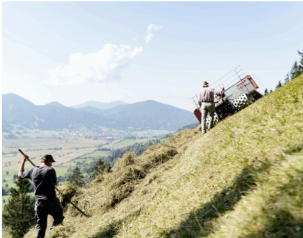
Landwirtschaft in der Zugspitz Region