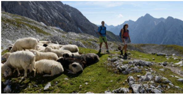
Wandern in der Zugspitz Region

Faszination, Dynamik, Weitblick und Beharrlichkeit – dafür steht die Zugspitz Region, ein touristischer Zusammenschluss dem sechs oberbayerische Destinationen angehören: das Zugspitz Land, die Alpenwelt Karwendel, das Blaue Land, der Naturpark Ammergauer Alpen sowie die Gemeinden Garmisch-Partenkirchen und Grainau.