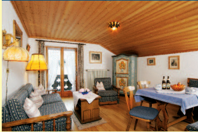
FERIENWOHNUNG NR. 2