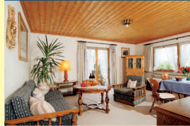
FERIENWOHNUNG NR. 4