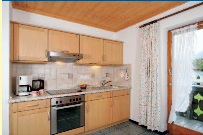
1. STOCK – SÜD- UND OSTBALKON