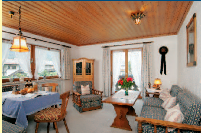
FERIENWOHNUNG NR. 3